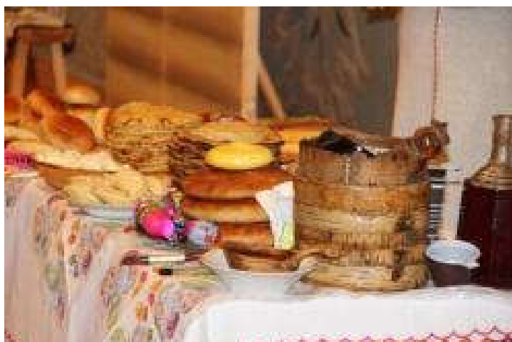
Рис. 3. Скриншот сайта «MariUver | Страница, посвященная марийцам, Республике Марий Эл, финно-угорским народам»

При ознакомлении с обрядами мари мы использовали сайт «MariUver | Страница, посвященная марийцам, Республике Марий Эл, финно-угорским народам» (рис. 3) [10]. Здесь представлена информация о марийском фольклоре и традициях в виде текстового и видео-материала о разных праздниках (календарно-обрядовый «Кугече», «Шорыкйол», «Ўярня»), даны методические рекомендации по их проведению, интерпретированы сакральные смыслы элементов национального костюма.