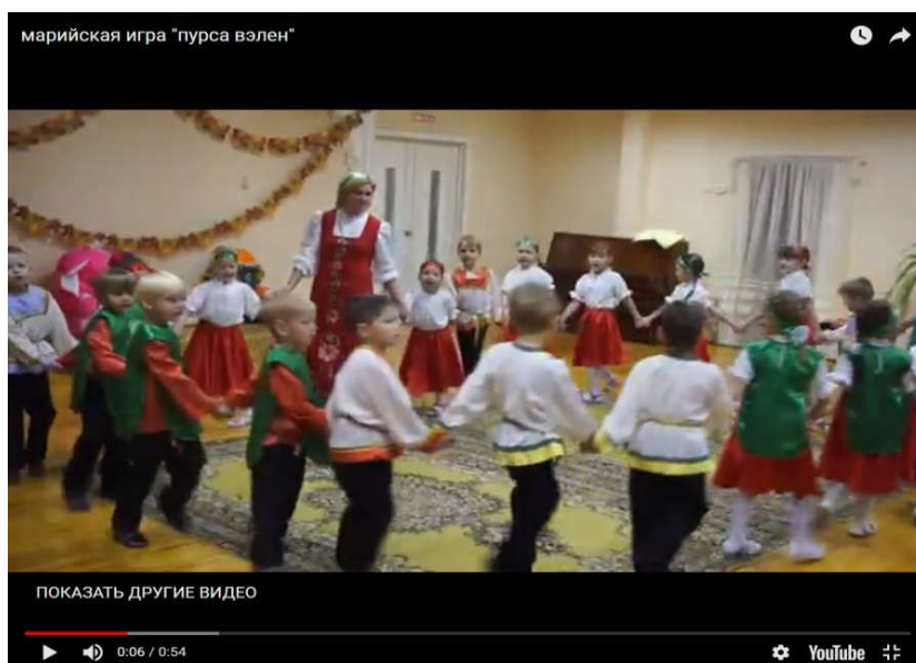
Рис. 4. Видеофрагмент игры «Пурсавелын» («Горох рассыпался»)

Для знакомства с традиционными марийскими играми мы воспользовались электронным ресурсом «История, обычаи, обряды и верования народа мари» [1]. Например, видеофрагмент игры «Пурсавелын» («Горох рассыпался») (рис. 4) позволил детям быстро освоить правила ее проведения и вызвал интерес к другим народным играм.