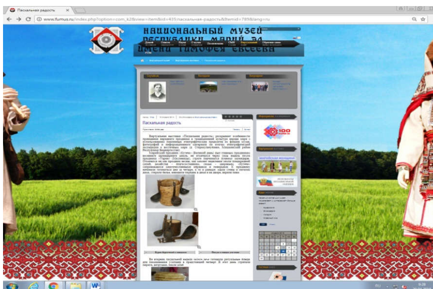
Рис. 5. Скриншот сайта Национального музея Республики Марий Эл имени Тимофея Евсеева

Эффективной инновационной формой этнокультурного развития детей, как показала практика, является виртуальная экскурсия – посещение сайтов, например, музеев («Национальный музей Республики Марий Эл имени Тимофея Евсеева») (рис. 5) [2], этнографических комплексов (открытый этнографический комплекс г. Козьмодемьянска), национальных деревень (Визимьбиль) и др.