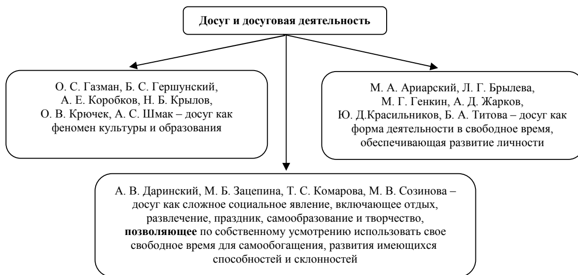
Рис. 1. Подходы к пониманию досуга и досуговой деятельности

Плодотворность организуемой на базе дошкольного образовательного учреждения досуговой деятельности зависит и от близких родственников ребенка, активно вовлекаемых в нее. Одно из исследований В. С. Собкина напрямую посвящено теме взаимодействия семьи в досуговой деятельности [7]. На приведенном ниже рисунке 2 представлены несколько сюжетов организации детского досуга.