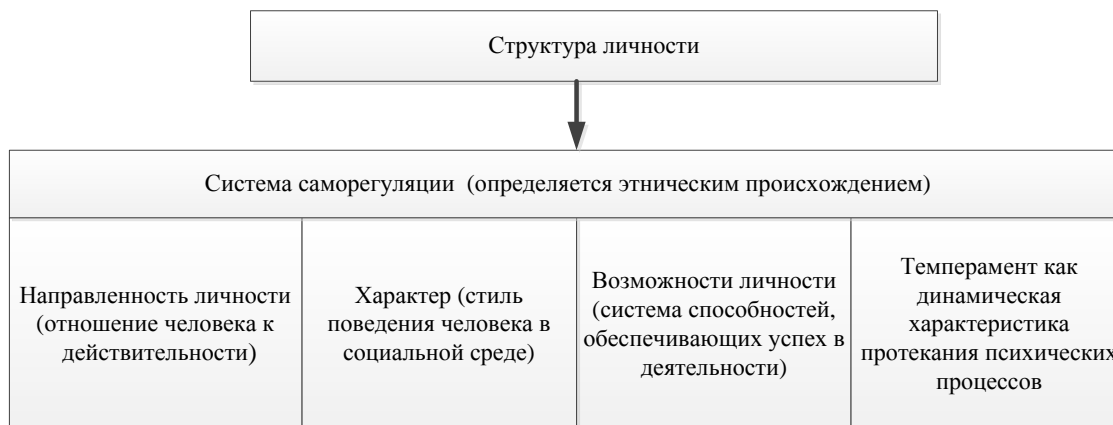
Рис. 1. Структура личности (по К. К. Платонову)

Рассмотрим теперь указанные компоненты структуры личности в контексте этнопедагогической теории. Направленность личности (первый блок) однозначно определяется этническим происхождением, восприятие действительности всегда происходит через призму этнического происхождения, это заложено генетически.