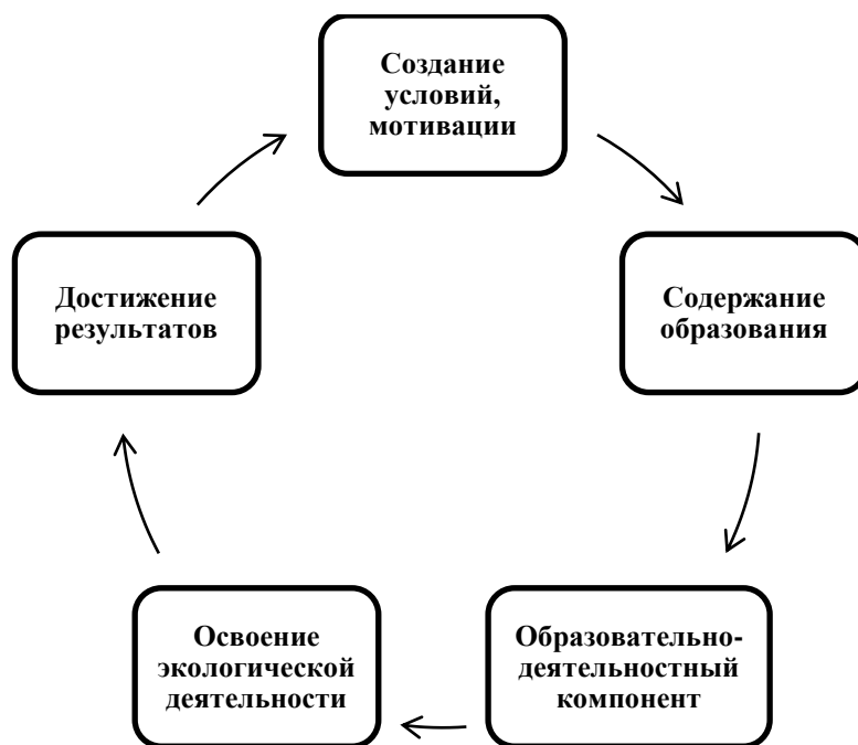
Рис. 2. Модель формирования эколого-правовой компетенции у студентов

Преподавание экологического права было построено с учетом полученных результатов. Формирование эколого-правовой компетенции должно основываться на интеграции положений концепции устойчивого развития в соответствующие темы предмета и уделении особого внимания положительному опыту обучения, способствующему формированию навыков устойчивого образа жизни в вузе, семье и обществе [4]. Целью преподавания стало не только изучение норм отрасли экологического права, но и формирование эколого-правовой компетенции интерактивными методами, которые понимаются как нахождение в постоянном, активном взаимодействии, в режиме диалога, общего действия всех участников процесса обучения. При этом все участники образовательного процесса активно общаются, обмениваясь друг с другом знаниями, идеями, методами и способами работы, что повышает эффективность восприятия теоретического материала и решения практических задач [22], [25].