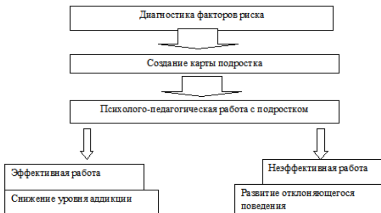
Рисунок 1 – Комплекс действий педагогических работников по педагогической поддержке подростков, склонных к девиантному поведению

Рассмотрим комплекс действий, включенных в процесс педагогической поддержки, рекомендованный для применения в работе специалистов сопровождения: