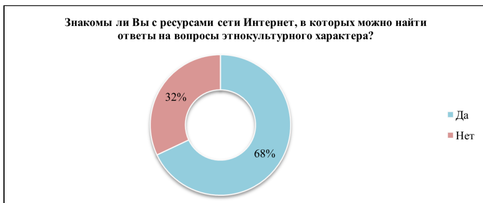
Рис. 2. Процентное соотношение ответов по 2-му вопросу

На второй вопрос: «Знакомы ли Вы с ресурсами сети Интернет, в которых можно найти ответы на вопросы этнокультурного характера?» – 68 % ответили «да», а 32 % – «нет» (рис. 2). Данные показатели свидетельствуют о том, что большая часть респондентов осведомлена о ресурсах, находящихся в сети Интернет, и, возможно, активно ими пользуется. Стоит отметить, что в последние годы возросла популярность электронных ресурсов этнокультурной направленности. На наш взгляд, это связано, во-первых, с ситуацией, возникшей с распространением коронавирусной инфекции COVID-19, а во-вторых, с цифровой трансформацией образования.