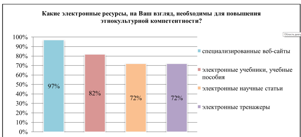
Рис. 4. Процентное соотношение ответов по 4-му вопросу

На четвертый вопрос: «Какие электронные ресурсы, на Ваш взгляд, необходимы для повышения этнокультурной компетентности?» – 97 % опрошенных ответили «специализированные веб-сайты», 82 % – «электронные учебники, учебные пособия», 72 % – «электронные научные статьи», 72 % – «электронные тренажеры» (рис. 4). Как показывают данные, веб-сайты являются самыми популярными электронными ресурсами и это не удивительно. Многими авторами отмечается огромный образовательный потенциал веб-сайтов [5], [10], [12], в частности и в вопросах этнокультурного характера [13], [2], [4], [11]. Очевидно, что научные статьи, учебники и учебные пособия содержат в себе бесценный опыт, а также структурированную и достоверную информацию, но именно электронная версия этих трудов дает возможность ознакомиться с ними более широкому кругу лиц, т. е. данная информация становится более доступной. Электронные тренажеры как одно из средств повышения этнокультурной компетентности позволяют отработать умения и навыки, применяя на практике полученные ранее знания. Одним из преимуществ данного средства является его доступность в любое время, а также многократность повторений, что позволяет лучше отработать умения и навыки и, соответственно, закрепить их.