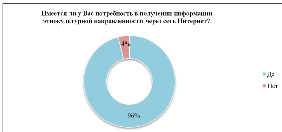
Рис. 3. Процентное соотношение ответов по 3-му вопросу

На четвертый вопрос: «Какие электронные ресурсы, на Ваш взгляд, необходимы для повышения этнокультурной компетентности?» – 97 % опрошенных ответили «специализированные веб-сайты», 82 % – «электронные учебники, учебные пособия», 72 % – «электронные научные статьи», 72 % – «электронные тренажеры» (рис. 4). Как показывают данные, веб-сайты являются самыми популярными электронными ресурсами и это не удивительно. Многими авторами отмечается огромный образовательный потенциал веб-сайтов [5], [10], [12], в частности и в вопросах этнокультурного характера [13], [2], [4], [11]. Очевидно, что научные статьи, учебники и учебные пособия содержат в себе бесценный опыт, а также структурированную и достоверную информацию, но именно электронная версия этих трудов дает возможность ознакомиться с ними более широкому кругу лиц, т. е. данная информация становится более доступной. Электронные тренажеры как одно из средств повышения этнокультурной компетентности позволяют отработать умения и навыки, применяя на практике полученные ранее знания. Одним из преимуществ данного средства является его доступность в любое время, а также многократность повторений, что позволяет лучше отработать умения и навыки и, соответственно, закрепить их.