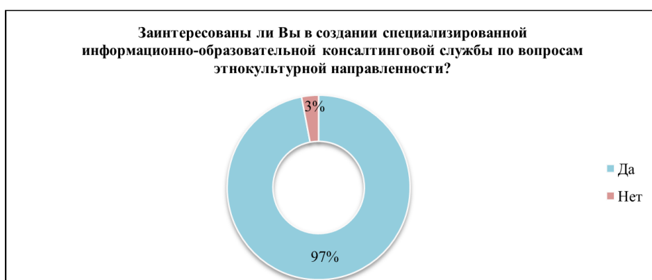
Рис. 5. Процентное соотношение ответов по 5-му вопросу

На пятый вопрос: «Заинтересованы ли Вы в создании специализированной информационно-образовательной консалтинговой службы по вопросам этнокультурной направленности?» – 97% опрошенных ответили «да», 3 % – «нет» (рис. 5). Анализируя данный вопрос, мы можем предположить, что информация, находящаяся в сети Интернет, не всегда является достоверной и структурированной, чем и вызван интерес к созданию информационно-образовательной консалтинговой службы.